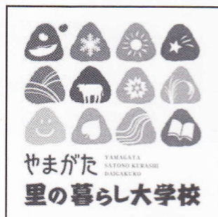
▲やまがた里の暮らし大学校 シンボルマーク