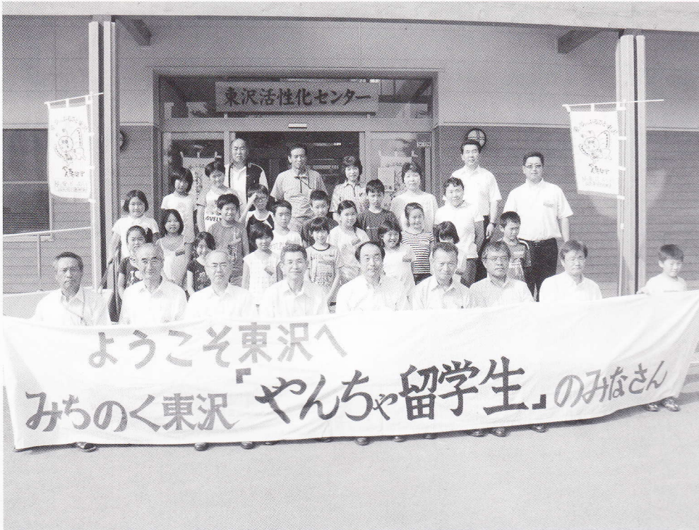
▲東沢地区と町田市との交流「やんちゃ留学」は20周年を迎えました。

今年からの5カ年が対象となる第4次川西町総合計画後期基本計画。この計画で示した3つの重点プロジェクトのひとつが「交流基盤確立プロジェクト」です。 地方では大幅な人口減少と高齢化が進展し、地域の担い手不足が深刻化する一方、都市では地方でのゆとりや豊かさ志向するライフスタイルへの関心が高まっています。 このプロジェクトでは、これらの背景を踏まえ、都市からの人の流れを活発化することによって川西町のファンを増やすことを第一の目標としています。さらには、交流を通じて地域の宝の再確認や商品の販売促進、定住者の増加等によりもたらされるマンパワーや新たな知恵などの効果で、地域がより元気なることを目指していくものです。